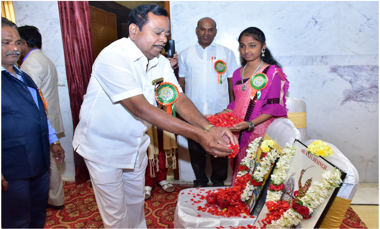
Tribute to Raja Desingh during TNRBA Golden Jubilee Celebration at Hosur on 12.01.2020