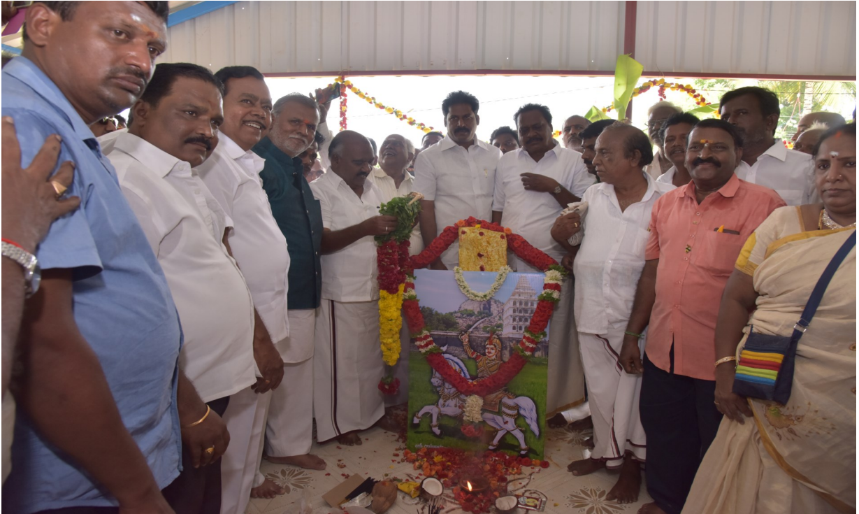
Raja Desingh's 304th Anniversary Celebration at Gingee on 03.10.2018