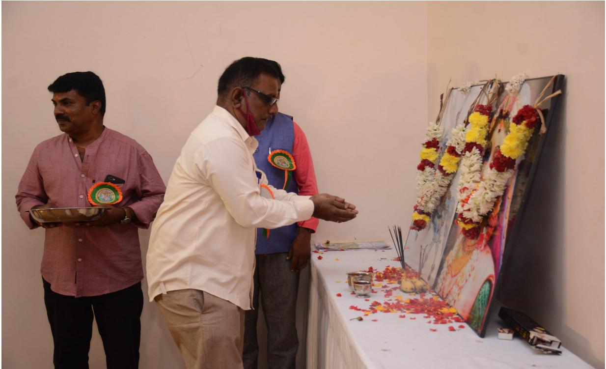
Tribute to Raja Desingh during Family Meet Gathering Function at Coimbatore on 03.01.2021